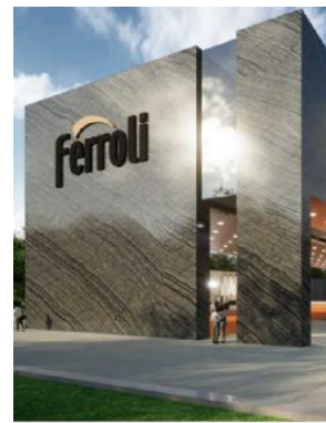
La riproduzione della Ferrolì sul Metaverso

TRANSIZIONE ECOLOGICA Progetto industriale e di formazione, anche dei clienti, con Lenovo e Hevolus Innovation