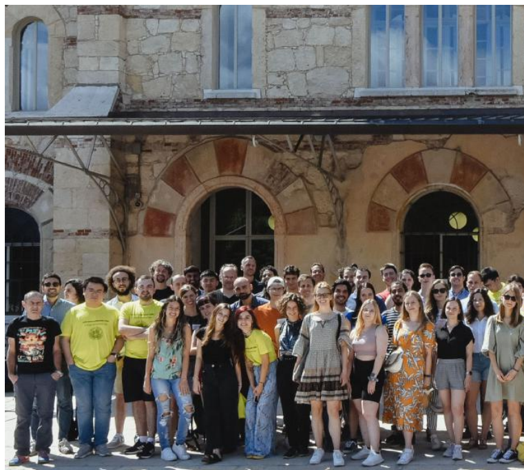
La presentazione dei vari progetti in gara dei 50 studenti (vedi sopra) dell'Ecmi (Consorzio Europeo per la Matematica nell'Industria) Modelling Week a Verona

«Quando i veicoli si fermano e ripartono frequentemente, infatti, generano un'onda che rispetto alla loro traiettoria viaggia all'indietro - spiega il professor Orlandi - rappresentando non solo un pericolo per la sicurezza, ma anche un impatto negativo su consumi e ambiente. Gli studenti hanno pertanto creato un modellino di traffico autostradale e tramite delle simulazioni hanno studiato tempi e modi di propagazione delle onde, per infine testare una soluzione volta a smorzare sul veicolo, ossia l'introduzione di veicoli autonomi a velocità controllata che inducano le auto retrostanti ad adeguarsi al