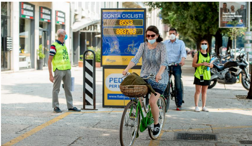
Il display conta biciclette sulla pista ciclabile in Corso Porta Nuova all'incrocio con via Locatelli

MOBILITÀ GREEN La rete crescerà fra qualche anno anche grazie ai fondi del Pnrr: in arrivo 2,3 milioni di euro nella città scaligera. «Ma servono percorsi di qualità», afferma la Fiab