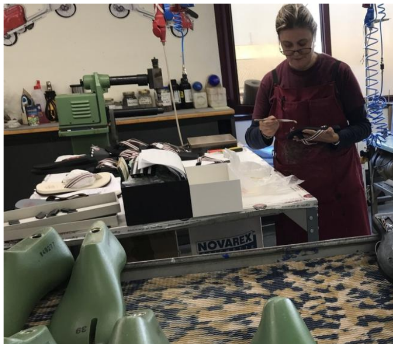
Una fase della lavorazione al calzaturificio Jumbo e (sotto) un negozio monomarca della Frau

Il Veneto in testa: +10,7% di export in valore su gennaio-marzo 2021