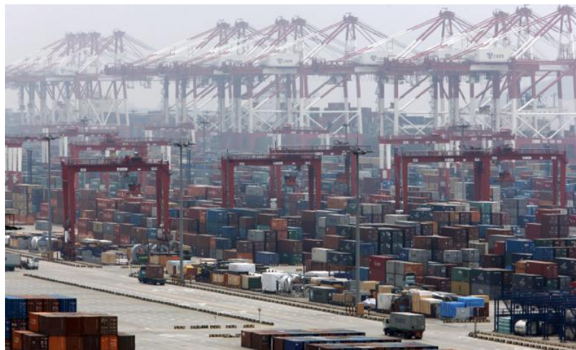
Il porto di Shanghai in Cina è lo scalo commerciale più grande al mondo per numero di container movimentati

Collegato alla questione delle sanzioni è il tema delle black list, nelle quali sono presenti nomi di oligarchi, molti dei quali riconducibili - direttamente o indirettamente - a società e con le quali gli imprenditori italiani hanno rapporti economici. «Per chi lavora con la Russia», suggerisce Poggi, «diventano quindi obbligatorie, oggi, delle verifiche per evitare che i propri prodotti finiscano a questi soggetti. Allo stesso modo è vietato mettere a disposizione dei soggetti listati risorse economiche. Le liste sono diverse: ci sono quella dell'Ue,