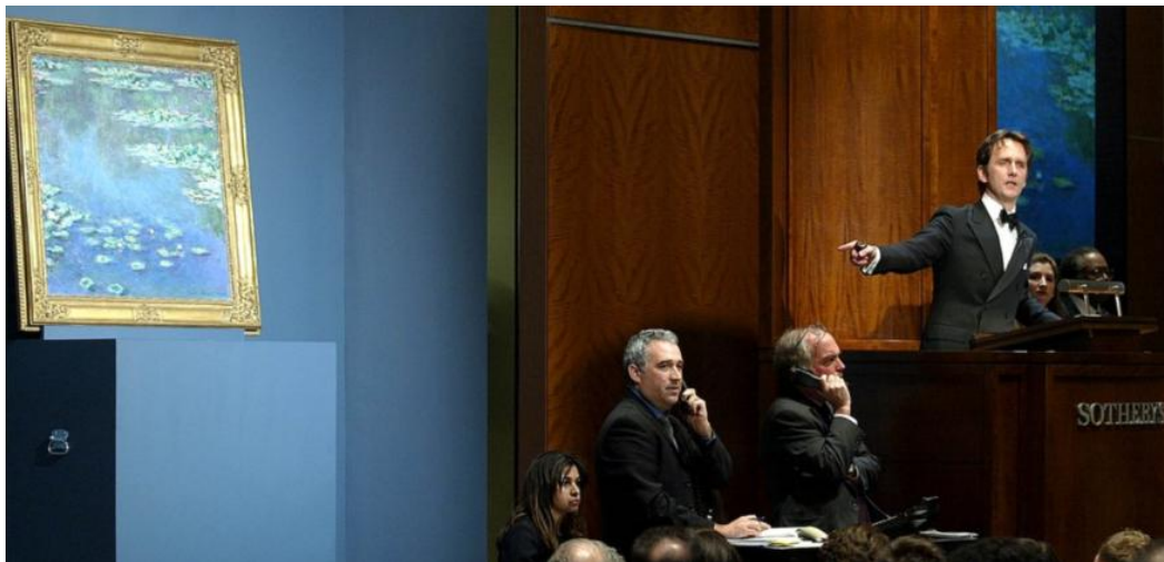
Un quadro di Claude Monet (La Ninfa) all'asta di Sotheby's a New York venduto nel 2002 a 18,7 milioni di dollari