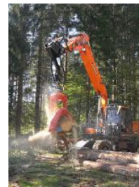
Oggi l'Italia è coperta per circa il 40% da boschi